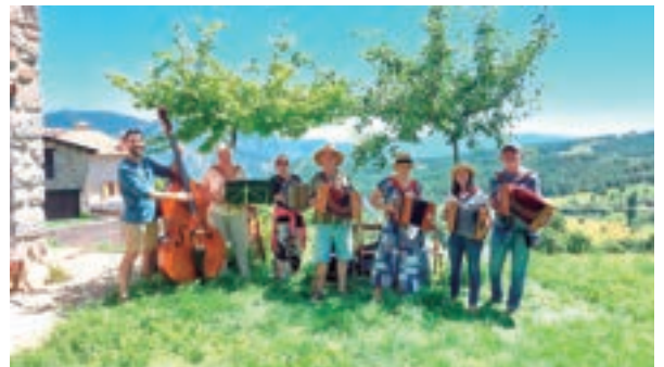
Actuació al Parc Catalunya - Sabadell