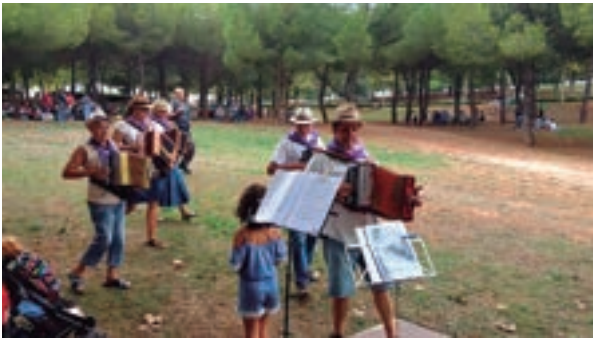
Actuació a Maçaners

actes de la ciutat, sovint per encàrrec de l'Ajuntament de Sabadell com la Festa Major