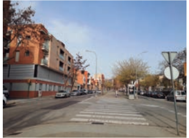
2024 - Ronda Collsalarca entre Lluçanes y la Lanera

Sus vecinos se han hecho mayores y ahora necesitan unos servicios que sólo se los puede dar la administración, como: atención personalizada, seguimiento de aquellos vecinos que viven solos y que necesitan un seguimiento particular, atención sanitaria, ver si pueden valerse por sí solos, si necesitan a alguien que les haga la compra, pero sobre todo esa compañía, ese rato de conversación donde los recuerdos salgan a relucir, donde poder demostrar que siguen vivos y que no serán descubiertos por el olor que dejan después