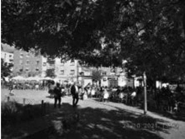
Plaza del Pi (más mesas que espacio de juegos)

Estos días he tenido una agradable sorpresa. Nos ha visitado un amigo de otro punto de nuestra geografía, y explica cuál es el motivo de su visita, aparte de volvernos a ver. Resulta que en su ciudad van a remodelar espacios públicos, con la idea de aportar novedades que favorezcan al ciudadano en particular, está haciendo recorrido por distintos lugares. Sabadell le ha interesado y Ca n'Oríac especialmente. Paseamos por el eje principal que es la Avenida Matadepera, Plaza El Pi, Plaza Farell y otras que no están tan en primera línea. El movimiento de personas, es lo primero que le llama la atención. El gran número de establecimientos, de todo tipo, que le hace pensar que está garantizado el comercio de proximidad. Las zonas verdes que le parecen muy saludables para la propuesta en su ciudad. De pronto se para y me dice, hay una cosa que no llevare como propuesta. Creo que hay una invasión de ocupación de vía pública y que