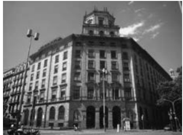
Institut Català de la Salut

Los deberes siempre son impopulares, pero los que mandan no quieren entender que su obligación es recoger opinión, informar, enseñar, proponer y finalmente ejecutar.