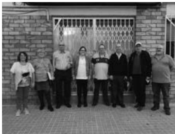
Equipo de la Vocalía de Decesos

RECUERDEN que es muy importante para todos nosotros las altas de nuevos asociados jóvenes, ya que sin ellos esto no podría funcionar.