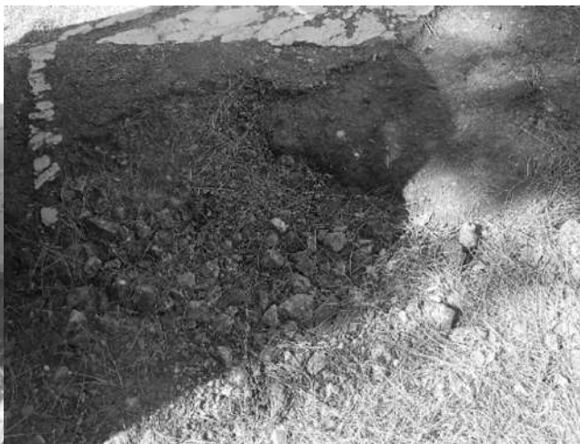
Socavones y algo más en la Plaza Fuensanta