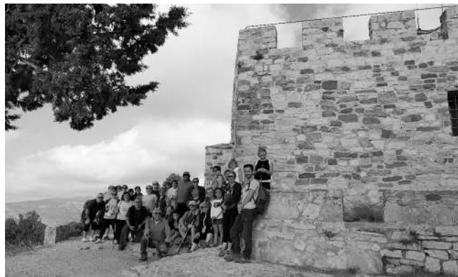
El Puig de la Creu