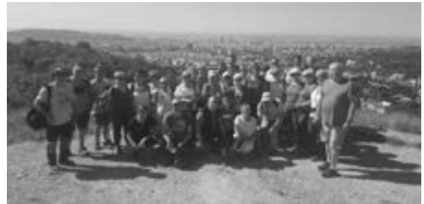
Carretera de les Aigües

Carretera de les Aigües - Plaça Catalunya. La última ha sido algo diferente porque hemos empezado el paseo en Vallvidrera. Desde la montaña se tienen unas vistas espectaculares de Barcelona donde hemos parado a desayunar observando el perfil de la ciudad y el mar mediterráneo al fondo. La bajada nos ha permitido adentrarnos a la ciudad más poblada a través del barrio de Sant Gervasi entomando la calle de Gran Gràcia y su ensanche en Paseo de Gracia hasta Plaça Catalunya donde hemos cogido el tren de vuelta a Sabadell.