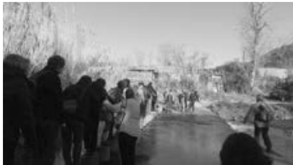
Riu Ripoll camí de Castellar

Riu Ripoll - Montcada i Reixach. Desde la estación Renfe-Centre bajamos al río para