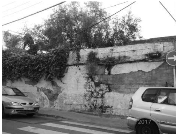
Calle Rosellón, 5

Quisiéramos saber qué gestión se va a hacer para regular la situación de la vivienda, quien tiene que tomar cartas en el asunto y estamos a la espera de respuesta.