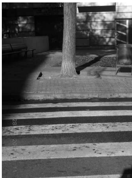
Calle Salenques (Bordillo sin rebajar en paso de peatones)

Por favor, acaben la faena y rebajen el bordillo. Gracias anticipadas