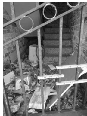
Calle Cadí (antes)