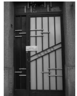
Calle Cadí (después)