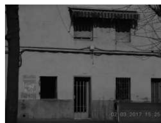
Ronda Collsalarca, 50-52 (fachada)