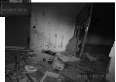
Ronda Collsalarca, 50-52 (interior)