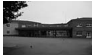
Escola Miquel Carreras

Benvolguts veïns del barri de Ca N'Oriach i lectors d'aquesta revista: