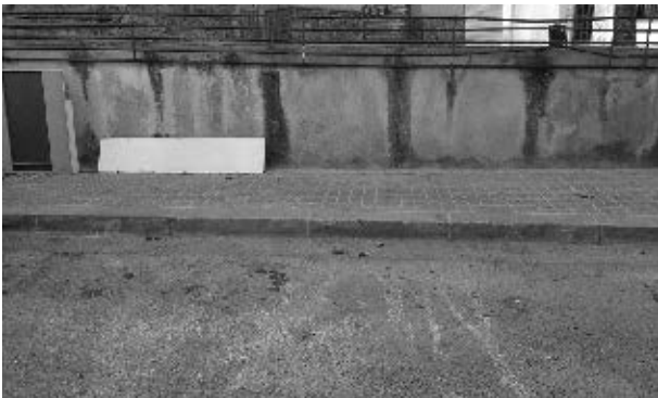
Vorera C/e Penedès

La nostra sorpresa va ser majúscula quan, en poc més d'un mes, vam veure el maquinari i els empleats treballant a la plaça fins deixar-la en un estat, que sense ser l'ideal, sí que possibilita que els infants puguin jugar sense perill d'entrebançar-se entre les rajoles i que els veïns puguin circular tranquil·lament per les voreres sense jugar-se una cama o un peu.