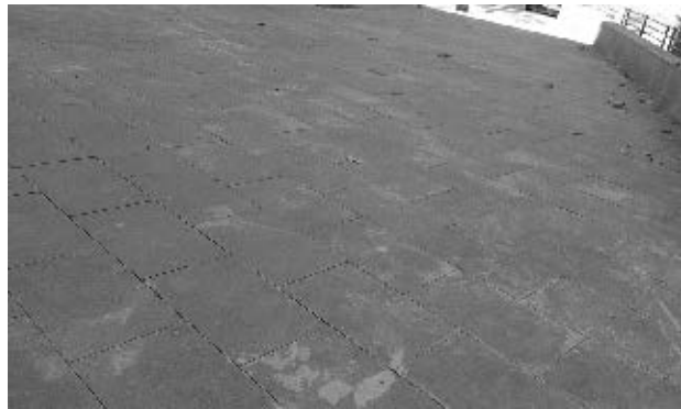
Rajoles de la plaça

Els arbres de la plaça, encara que no els van podar, sí que van tallar les branques inferiors que feien molta nosa i les que hi van quedar estan netes de paràsits.