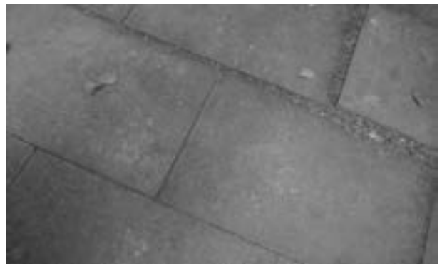
Rajoles aixecades fins a tres centímetres

Durant la passada campanya electoral municipal, van podar les branques de tots els arbres del barri, Avda Matadepera, Ronda Collsalarca ..., però en canvi se'n van oblidar de tallar les d'aquesta plaça, que sembla ser que per l'anterior consistori no hi constava com a tal.