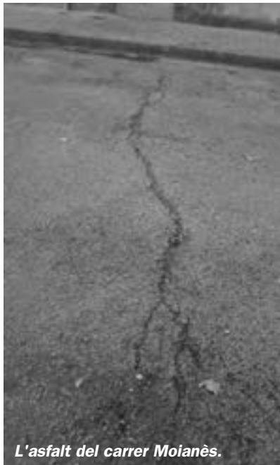
L'asfalt del carrer Moianès.

Aquest article és per denunciar l'estat d'abandó en el què es troba aquesta placeta, que durant uns quants anys ha servit per que les criatures hi