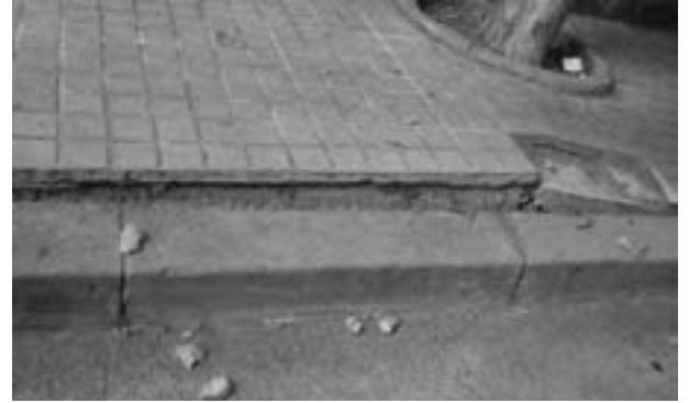
Vorera aixecada C/ Penedès

carrer, fins al punt que algun dia algú prendrà mal.