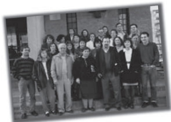
Primer equipo del CAP. Can Deu, 1985. Autor desconocido

En este período también se ponen en marcha el Centro Municipal de Planificación Familiar e Información Sexual, el Programa de Educación Materno-Infantil, el Centro Municipal de Vacunaciones, el Centro de Medicina Preventiva Escolar (después Servicio de Salud en la Escuela), el Laboratorio Municipal, el Centro de Atención Primaria en Salud Mental y el Centro de Salud Mental, Alcoholismo y Otras Toxicomanías (Sabadell es el primer lugar del Estado donde se ofrecen camas para la desintoxicación en un hospital público).