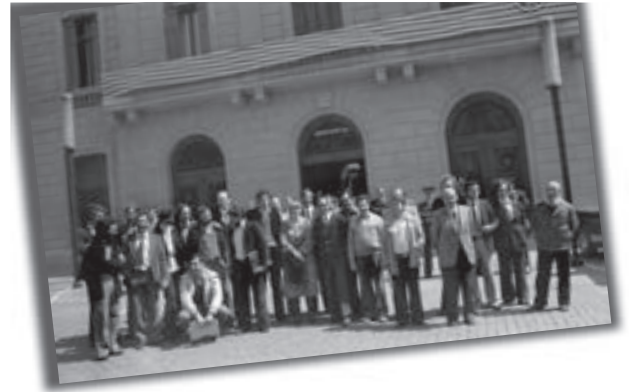
Equip de govern del nou Ajuntament de Sabadell a la plaça de Sant Roc, 19/04/1979.