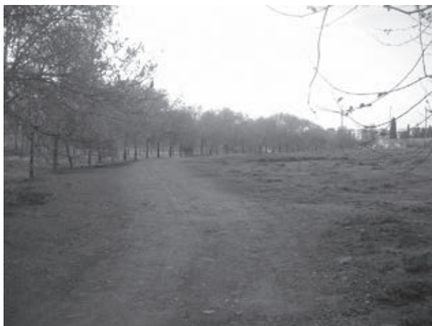
Situació del PARC DEL NORD Març del 2008. (Rda.Navacerrada-carrer Coronas)

Donat els anteriors antecedents, no ha d'existir obstacle per a la finalització del Parc Nord d'acord amb el projecte consensuat entre l'Ajuntament i les associacions de veïns del sector, per a això es fa necessari retirar les terres acumulades en el lloc on s'ha de construir el parc.