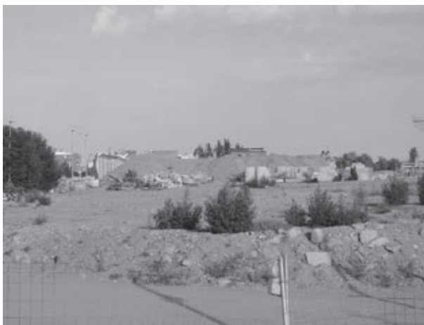
Situació actual, al PARC DEL NORD (cruïlla de Rda.Navacerrada i carrer Coronas)

Una Moció per debatre en el Ple de l'Ajuntament del mes de Juliol, en favor de construir al Parc Nord segons el projecte acordat entre Ajuntament i la Comissió del Parc Nord i la retirada de les terres que actualment ocupen l'espai en el qual s'ha de construir el parc.