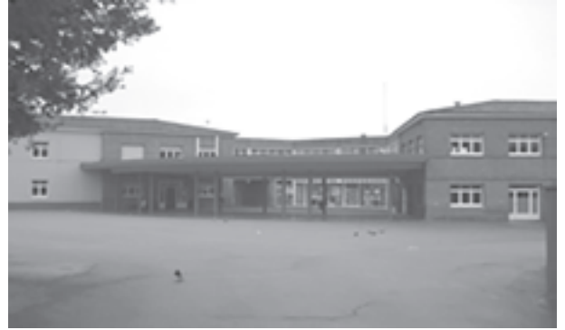
Escola Miquel Carreras

Benvolguts veïns del barri de Ca N'Oriach i lectors d'aquesta revista: