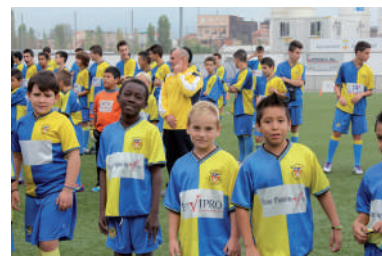
Foto de participantes en varias categorías