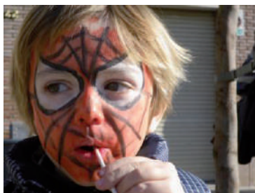
Febrero Cultural 2011

Desde el grupo de cultura de la Agrupación de Vecinos Ca n'Oriac, hace días que trabajamos en desarrollar el programa de actividades que integrarán la próxima edición del Febrero Cultural.