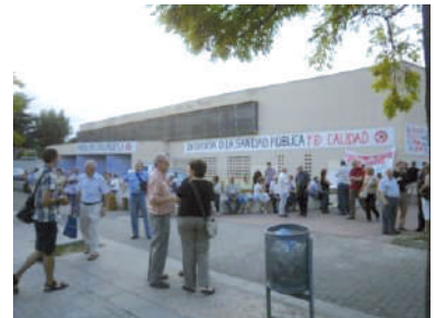
Protesta en el Cap

La caravana del día doce contó con la participación de un centenar coches y los 3 autocares de nuestro distrito, cerca de 400 personas fue una acción que demuestra el descontento existente por el deterioro de la sanidad publica impulsado desde el gobierno de CiU y el PP, con el fin de favorecer el sector privado. Este deterioro forma parte de los recortes globales al estado del bienestar, ya bastante reducido, donde la sanidad, la enseñanza las prestaciones sociales sufren recortes continuos. Para frenar estos objetivos de quienes defienden los intereses privados, la ciudadanía debe implicase y rechazarlos, apoyando y participando en las acciones.