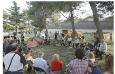
Acampada de los vecinos